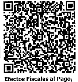
Efectos Fiscales al Pago.

Serie del certificado del SAT: 00001000000411580203