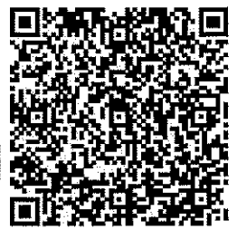
Efectos Fiscales al Pago.