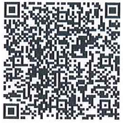
Efectos Fiscales al Pago.