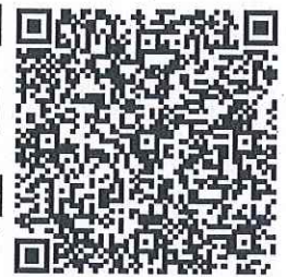
Efectos Fiscales al Pago.

||1.1|c04578c7-2be3-4015-8622-47e1013970a8|2019-07-01T16:10:44|DIG130917F9A||I4t4U31b2L7GQ95tLjaVCKXU5jp37i7IIBlpgtAcSBXFzoQ/Vee/3yiCizpvc736OrlgUPuSPv do+TRfr7PivF94B579FWkgTSZ9NHkIAG2u74zjVoT0G/Zz1TjL1tvJrm6M6az0gASXb4Np1nG5OnlAIF0fApA+INLzpb+CIUQLZekWm8vyCpAnDeSGerO8aChRHp7kSaaHS/ .CST51DuJOYIs0xLs75qOaXy9EOBaQRdjt+OFTE3w/fmWYwWTxj/y3DFN5ovBrZmlmwNKzMD+0iy8Kbu7U2wgOiuZelywGGVryb5KdEzA9KVe+EVpiKSV0/Sw=|000 0100000411500203||